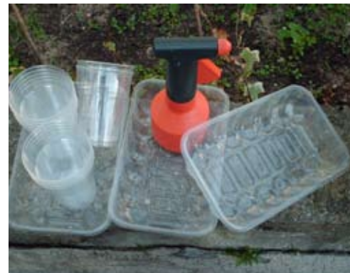
Il kit (tutto riciclato) del buon contadino urbano.